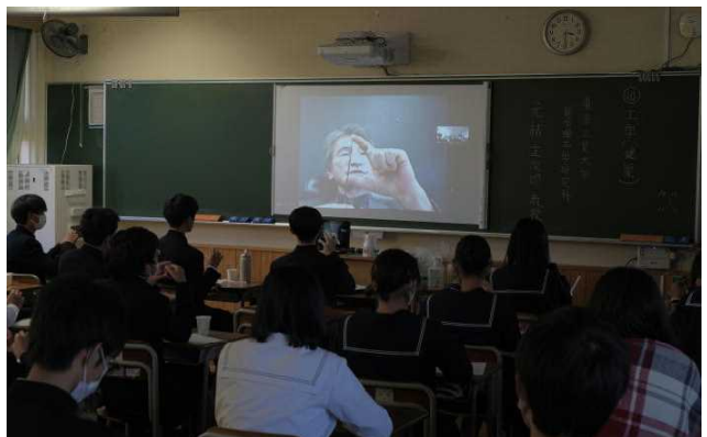
写真右:⑩元結教授の講座中、ハンダを曲げる様子